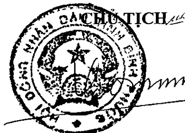
Trần Tuệ Hiền

Đối với những đối tượng đang được hỗ trợ kinh phí đào tạo theo quy định của Nghị quyết số 25/2011/NQ-HĐND ngày 16 tháng 12 năm 2011 của Hội đồng nhân dân tỉnh, nhưng đến thời điểm Nghị quyết này có hiệu lực mà chưa hoàn thành khóa học hoặc chưa nhận bằng tốt nghiệp thì được hỗ trợ kinh phí đào tạo theo các quy định của Nghị quyết này.